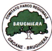
Comitato Parco Brughiera