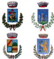
Comuni del territorio