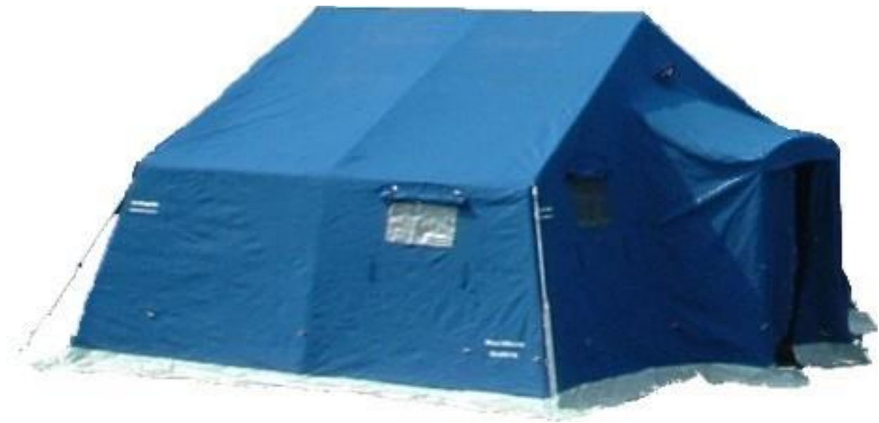
Tenda 6*5m tipo per campo profughi