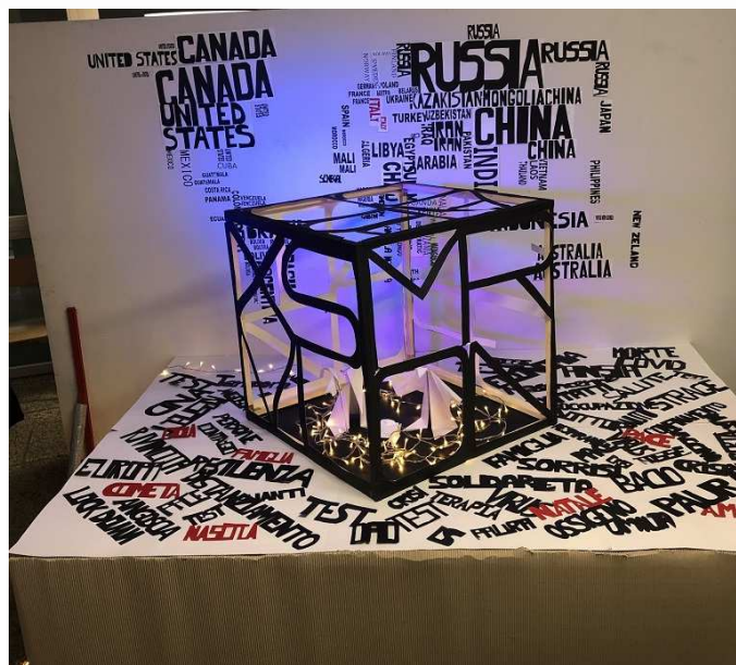
Il Presepe della Scuola Anna Frank