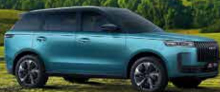
JAECCO 5 1.5-H