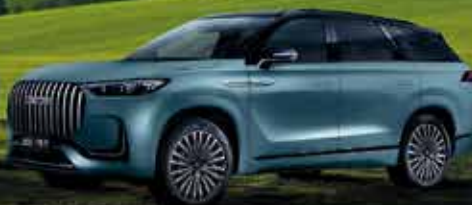
JAECCO 8 1.5-P

SCOPRI LA NUOVA GAMMA JAECCO SUPER HYBRID IN CONCESSIONARIA. A PARTIRE DA 23.800 €* IN CASO DI ROTTAMAZIONE.