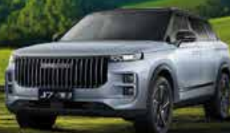
JAECCO 7 1.5-H